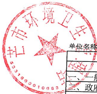
6-1 部门财务收支总体情况表