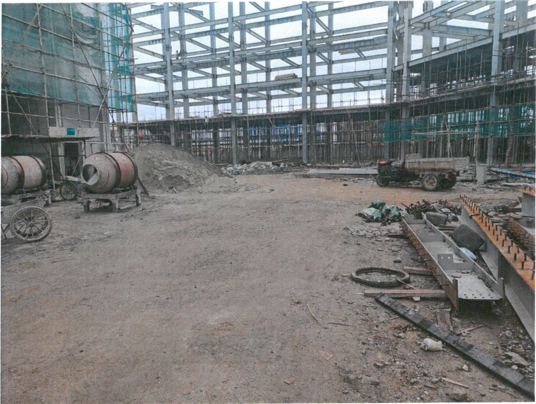
芒市玉丰汽车修理厂 5S 店整改后照片：