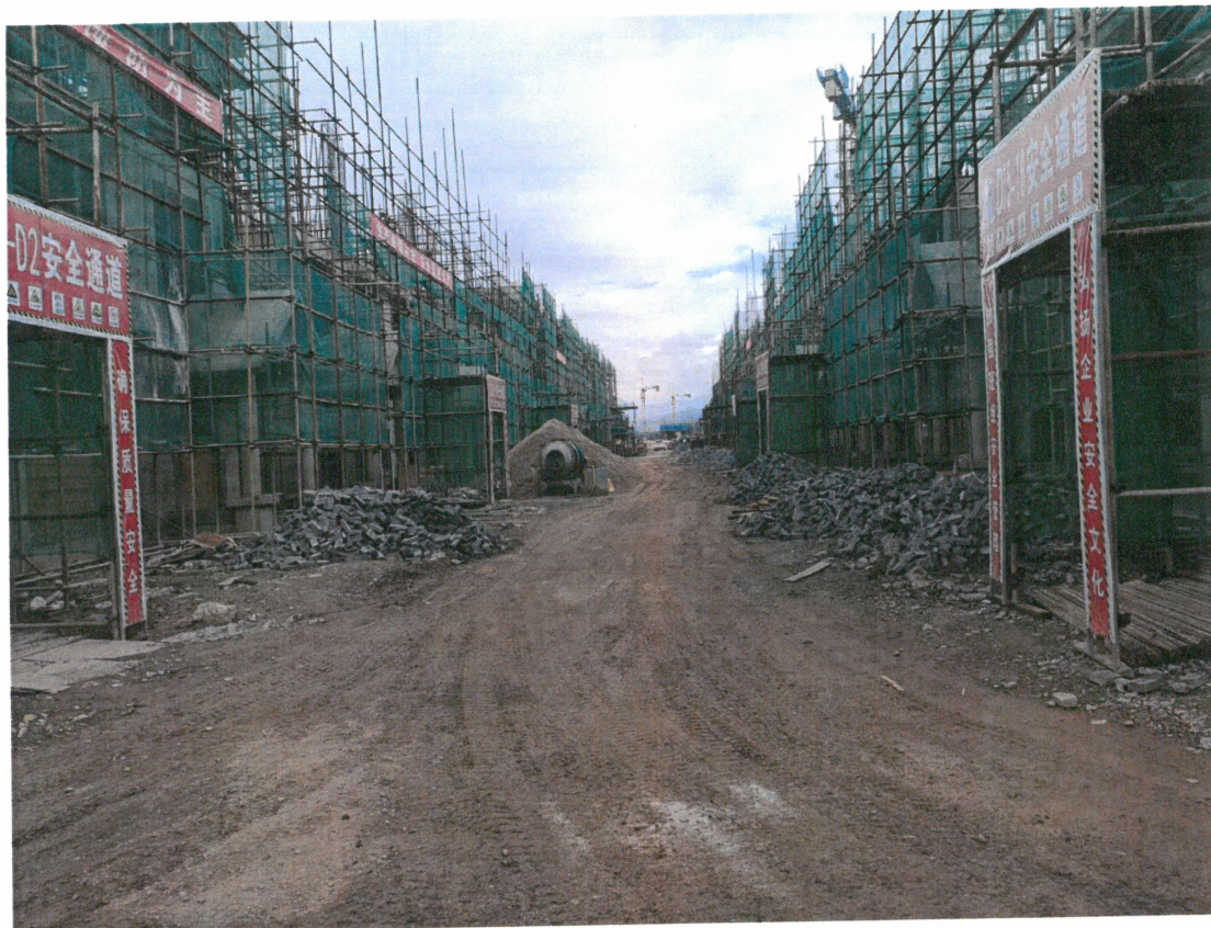
芒市湖畔嘉苑项目 B 区整改后照片：