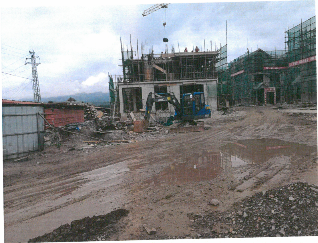
芒市湖畔嘉苑项目 B 区整改后照片：