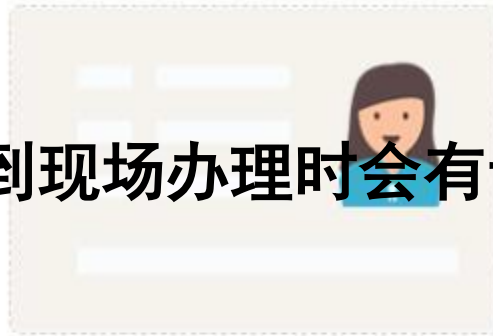
身份证照片人像面