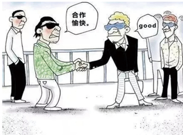
9 在境外黑社会入境发展渗透以及跨国跨境的黑恶势力。