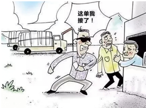
4 在建筑工程、交通运输、矿产资源、渔业捕捞等行业、领域，强揽工程、恶意竞标、非法占地、滥开滥采的黑恶势力。