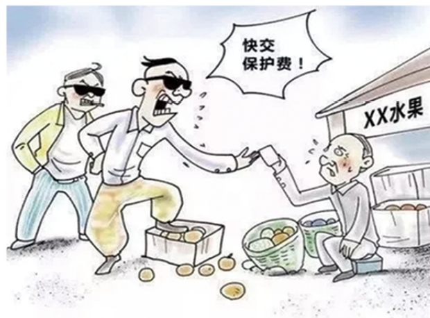
6 在商贸集市、批发市场、车站码头、旅游景区等场所欺行霸市、强买强卖、收保护费的市霸、行霸等黑恶势力。