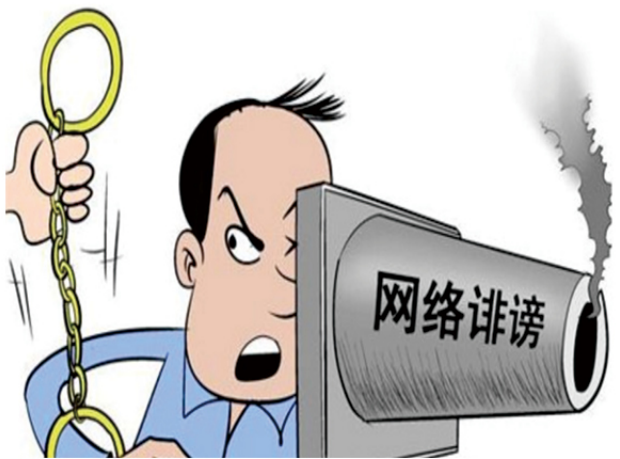
8 组织或雇佣网络“水军”在网上威胁、恐吓、侮辱、诽谤、骚扰的黑恶势力。