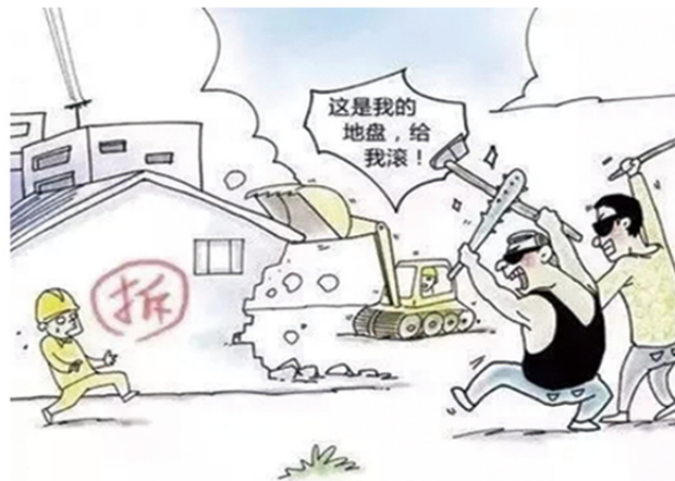
5 在征地、租地、拆迁、工程项目建设等过程中煽动闹事的黑恶势力。