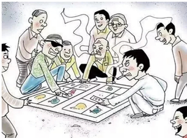
7 操纵、经营“黄赌毒”等违法犯罪活动的黑恶势力。