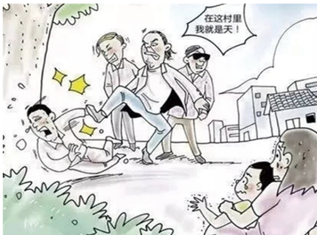
3 利用家族、宗族势力横行乡里、称霸一方、欺压残害百姓的“村霸”等黑恶势力。