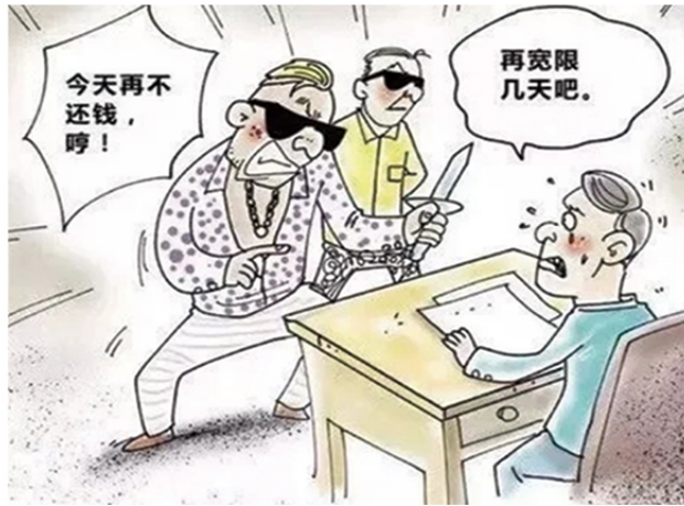
10 非法高利放贷、暴力讨债的黑恶势力。