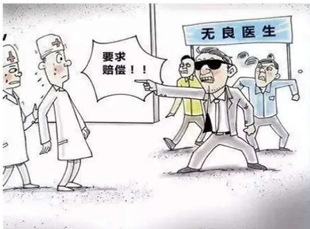
11 插手民间纠纷、充当“地下执法队”的黑恶势力。